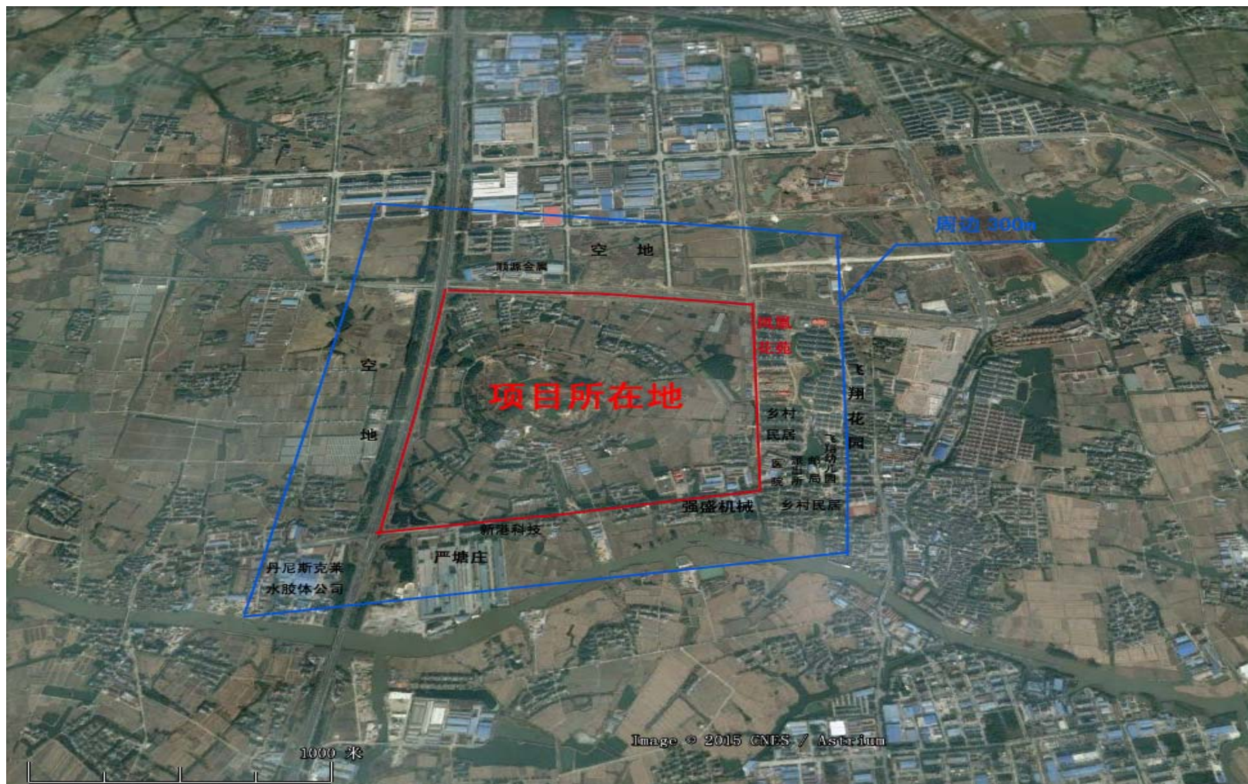
附图二 建设项目周边概况图