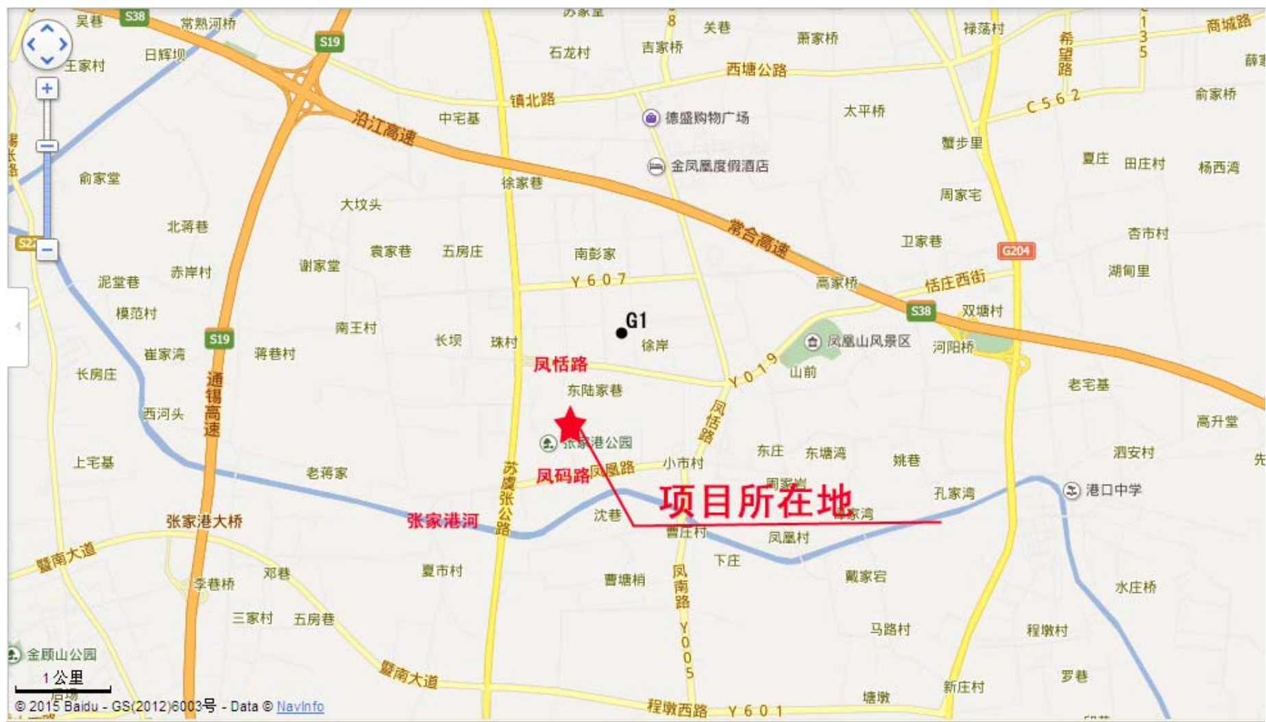
附图一 建设项目地理位置图